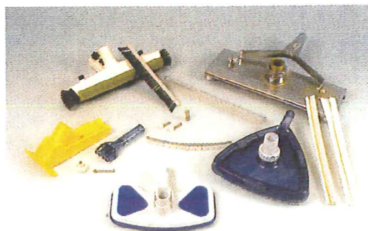
borstels en accessoires